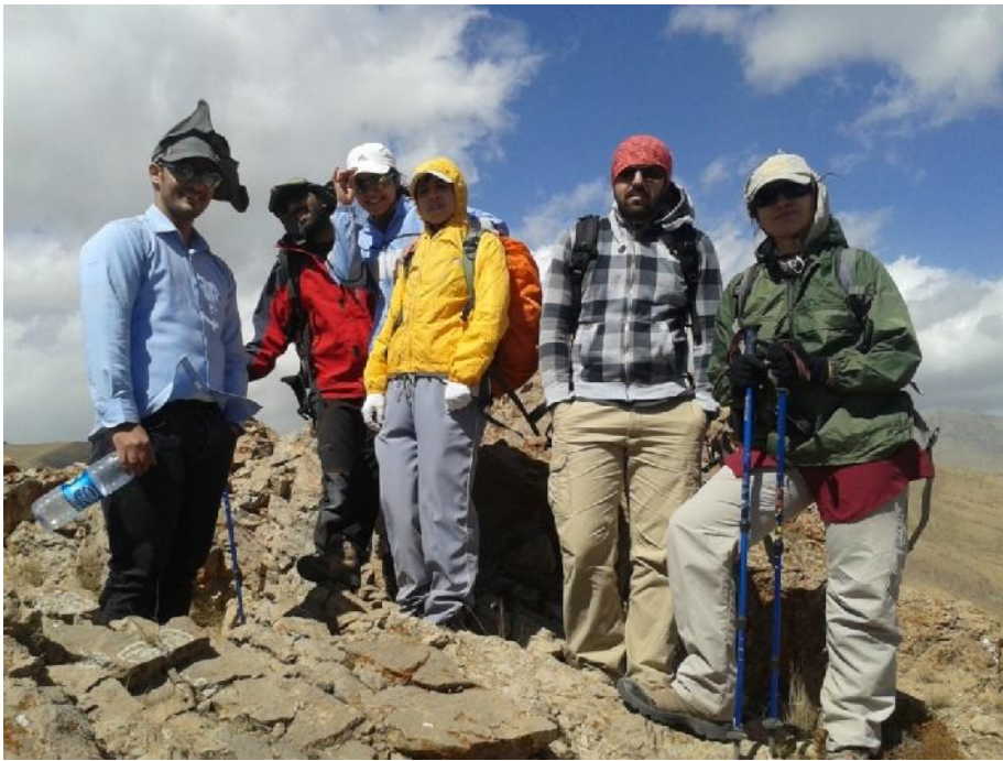
بر فراز قله اهنگرک