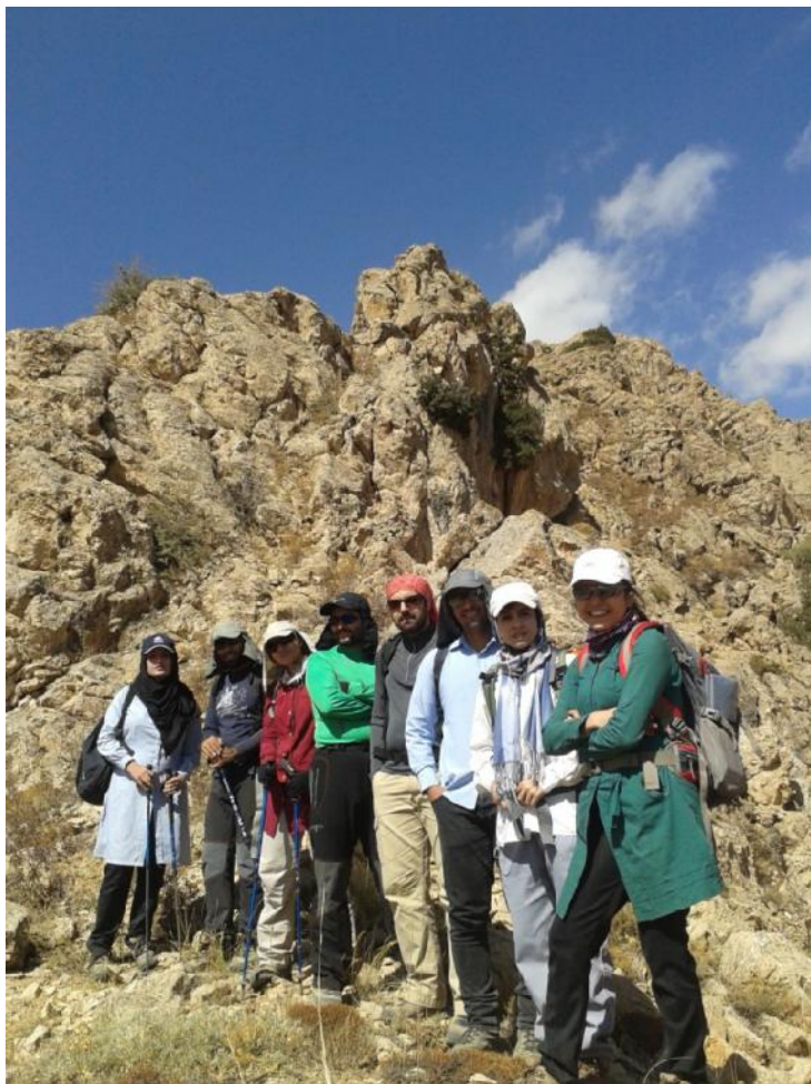
در مسیر قله