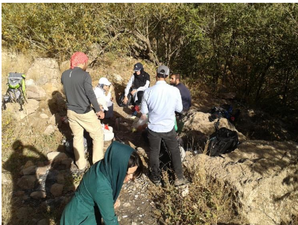
صرف صبحانه - عکاس: محمد مظاهری