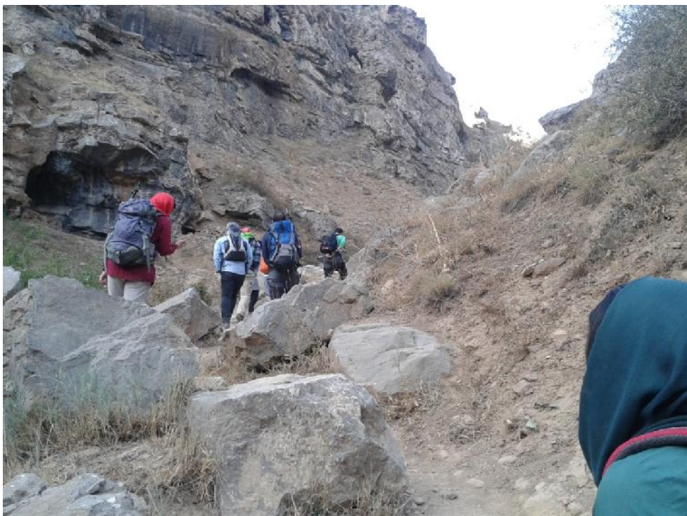
حرکت در ابتدای دره